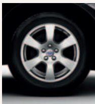
Talitha 20" 1)